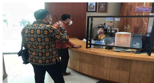
Foto Layanan Informasi Publik

Disamping penyediaan meja layanan informasi, untuk mengakomodir kepentingan publik dalam mengakses layanan permohonan informasi, Dinas Komunikasi, Informatika dan Statistik Kota Denpasar juga menyediakan akses layanan permohonan informasi PPID melalui e-mail koinfo@denpasarkota.go.id dan aplikasi online PRO Denpasar ( pengaduan.denpasarkota.go.id ) dan ppid.denpasarkota.go.id . dan juga portal denpasarkota.go.id Pemohon Informasi dapat dengan mudah mengakses layanan permohonan informasi secara online, kemudian permohonan informasi yang diterima secara online tersebut diproses melalui layanan back office oleh petugas layanan PPID.